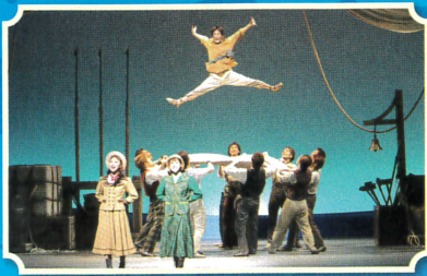
写真はすべてこれまでの公演より